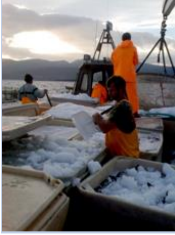
ZIEGRA buz makineleri: Balık soğutmanız için kırık buz