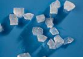
Küçük küp buz (Nugget)

Mükemmel buz ısısı -0,5 °C ile küçük 'küpler'.